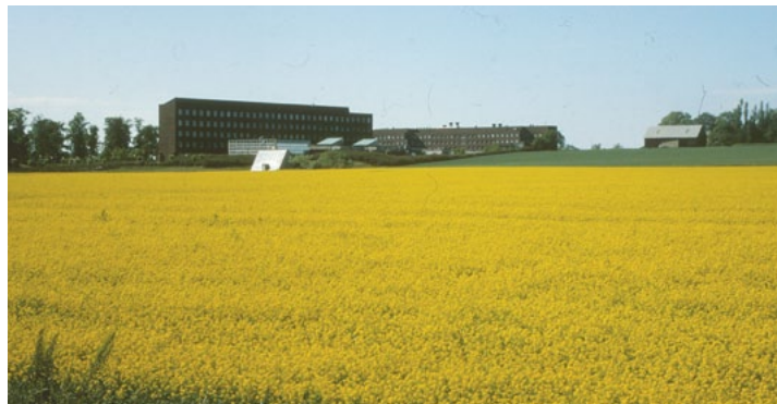
A-HUSET BLAND rapsfälten. Så här såg huset ut under sent 70-tal.

Mycket har blivit bättre i det om- och tillbyggda A-huset. Bland annat har de sociala ytorna ökat, biblioteket är placerat i husets hjärta och skolan har fått en bättre entré från söder. Här är en guide till det nya A-huset.