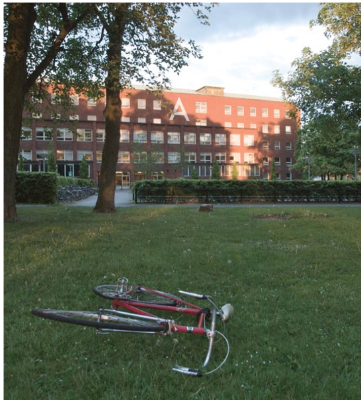
A-HUSET i skymning

Gemensamt pausrum för våning 4-5 med centralt belägen spiraltrappa