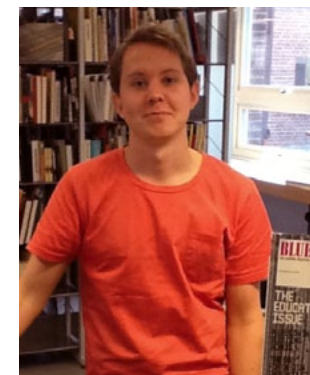
MATS jobbar i biblioteket sedan augusti 2012.